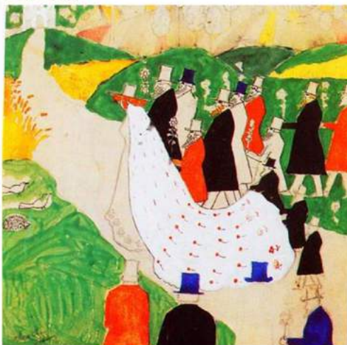
The wedding, Kazimir Malevich, 1907 (WikiArt.org - obra no domínio público)

Embora tenha declarado que o Regulamento Sucessões (Regulamento Nº 650/2012 de 4/7/2012) não é aplicável ao caso em análise, ratione temporis , o TJUE clarifica a fronteira entre o âmbito de aplicação deste Regulamento e do Regulamento Bruxelas IIa (Regulamento Nº 2201/2003 de 27/11/2003). Ou seja, define o que pertence ao domínio da responsabilidade parental e o que pertence ao domínio das sucessões.